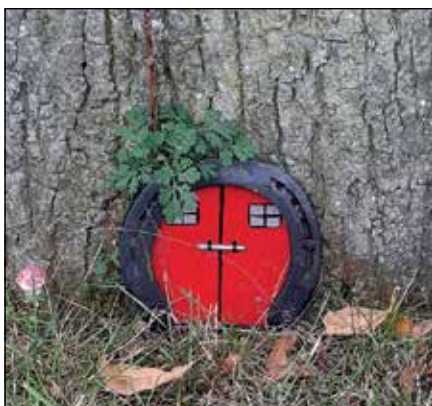
De eerste blaadjes vallen van de bomen, Paulus de boskabouter is niet thuis, hij gaat hout sprokkelen voor de winter...

De volgende Houwmouw zal maandag 22 november klaarliggen in de 'Droogloop'.