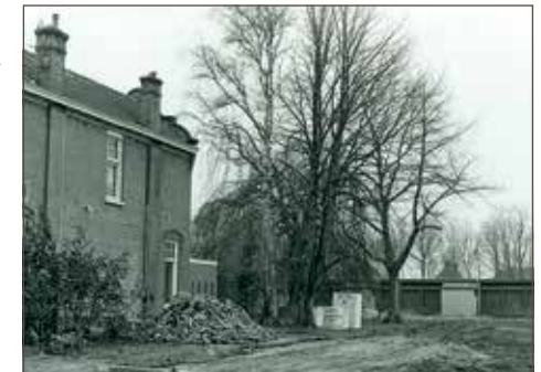
1996: drie lokalen achter school wijken voor Meester Knoopsstraat

In 1996 worden de drie semipermanente lokalen afgebroken, ze zijn te duur geworden. Tevens heeft de gemeente de grond nodig voor de nieuwe wijk die langs de school gepland is. Nauwelijks een jaar later is er alweer ruimtegebrek. Er zijn twee extra lokalen nodig die worden ingericht in de voormalige kleuterschool. In 2000 ontstaat er opnieuw ruimtegebrek en komen er nog twee noodlokalen bij. De school heeft dan maar liefst elf lokalen in gebruik. Daarna neemt het aantal leerlingen in snel tempo af.